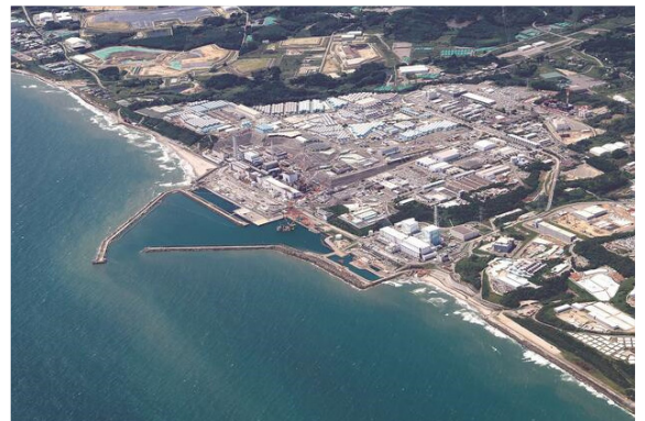
処理水の海洋放出が始まった東京電力福島第一原子力発電所 = 24 日

放出は今後、数十年続くとみられ、廃炉完了の目標の 2051 年までに終える計画だ。